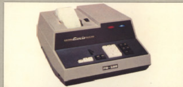
カシオPR-500 (現金正価) ¥395,000 ●同時に計算、同時に記録する卓上型電子記録計算機