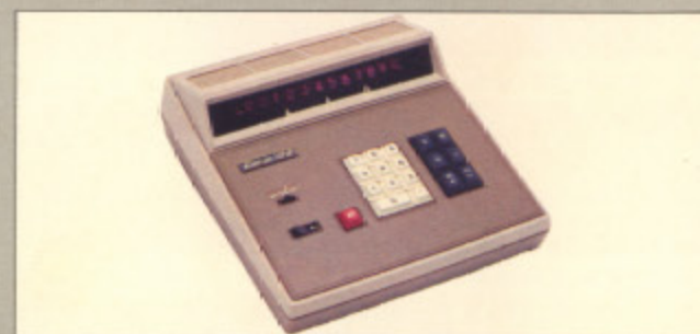
カシオ-122 (現金正価) ¥137,000 ●12桁、完全機能をもった高級機