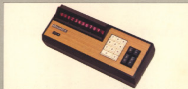
カシオAS-A (現金正価) ¥116,000 70,000 ●ズバリ合計がとれるメモリー付電子ソロバン