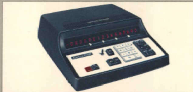
カシオ-161D (現金正価) ¥250,000 ●金融関係利息計算専用機