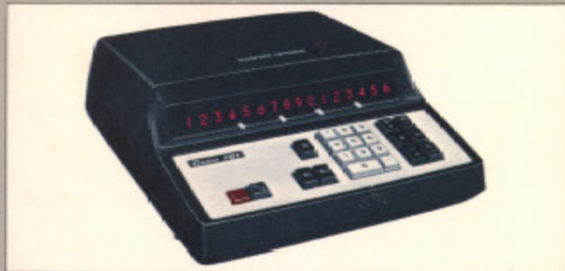
カシオ-161 (現金正価) ¥198,000 ●16桁、完全機能をもった高級機