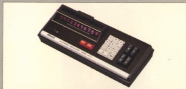
カシオAS-B (現金正価) ¥99,500 ●独創的なニューデザインのメモリー付電子ソロバン