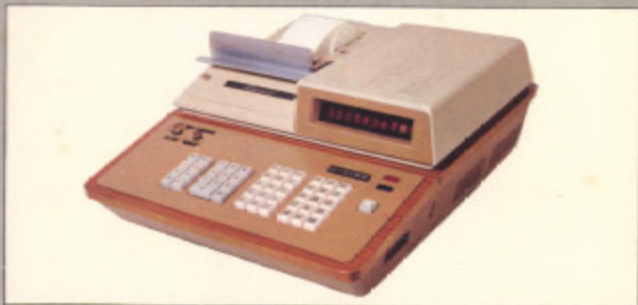
カシオΣ-3100 (現金正価) ¥680,000 ●30分度レジスターつき卓上型電子分類製計機