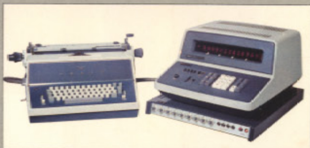
カシオAL-1000S (現金正価) ¥720,000 ●電卓、タイプライター、作表機と一台三役の卓上型電子作表計算機