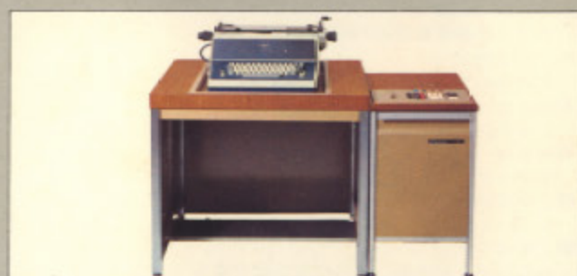
カシオΣ-5000シリーズ (現金正価) ¥1,200,000 ●記憶18組、豊富な演算作業能力をもち、総合的な合理化がはかれるミニコンピューター