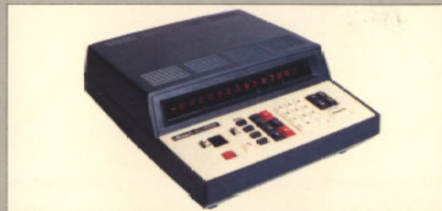
カシオAL-2000 (現金正価) ¥318,000 ●反復計算、科学技術用計算に最適の卓上型コンピューター