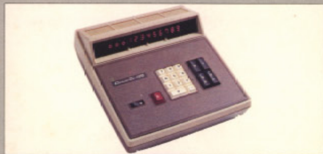
カシオCL-100 (現金正価) ¥89,000 ●12桁、定数機能、完全自動小数点方式