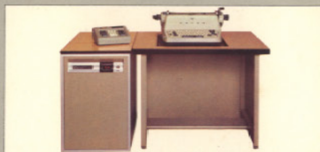
カシオΣT-1200シリーズ (現金正価) ¥870,000 ●伝票発行から管理資料作成まで抜群の威力を発揮するビルディングマシン